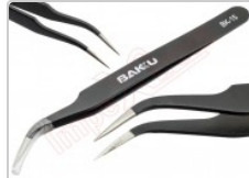
Pinza antiestática curva ESD-15