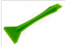
Herramienta profesional plástica doble para apertura de dispositivos

Para este manual necesitarás las siguientes herramientas y componentes que puedes adquirir en nuestra tienda on-line Impextrom.com Haz click encima de una herramienta para ir a la página web.