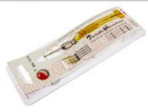
Destornillador de precisión BK-7275 con 5 puntas intercambiables