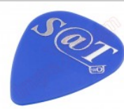
Púa especial SAT 0,70mm PET de alta fricción y resistencia