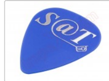
Púa especial SAT 0,70mm PET de alta fricción y resistencia