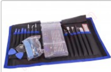
Kit de herramientas profesional 70 en 1