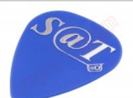
Púa especial SAT 0,70mm PET de alta fricción y resistencia