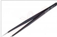
Pinza antiestática ESD redondeada