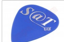
Púa especial SAT 0,70mm PET de alta fricción y resistencia