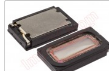
altavoz tono de llamada genérico de 16.02 x 9.04 x 3.61 mm