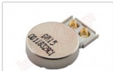
Vibrador genérico de 13,51 x 3,04 x 9,99 mm