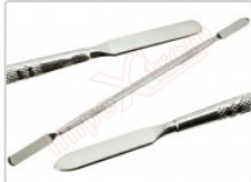
Espátula profesional de desmontaje para móviles y Smartphones

Para este manual necesitarás las siguientes herramientas y componentes que puedes adquirir en nuestra tienda on-line Impextrom.com Haz click encima de una herramienta para ir a la página web.