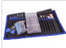
Kit de herramientas profesional 70 en 1