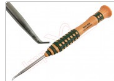
Herramienta profesional de punta curva para el desmontaje de