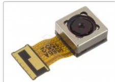
Cámara trasera de 5 mpx LG K7

Para este manual necesitarás las siguientes herramientas y componentes que puedes adquirir en nuestra tienda on-line Impextrom.com Haz click encima de una herramienta para ir a la página web.