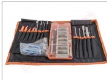
Kit de herramientas profesional 70 en 1