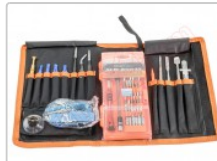
Kit de herramientas profesional 70 en 1