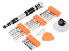
Kit de destornillador JM-8142 con 24 puntas y herramientas apertura