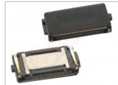
Altavoz auricular genérico de 12.98 x 6.01 x 2.05 mm