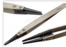
Pinzas antiestáticas VETUS ESD-242