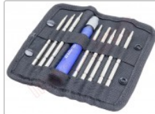
Estuche destornillador con 8 puntas Peng Fa 7339A