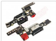
Placa auxiliar premium con componentes para Huawei p9 (eva-l09).