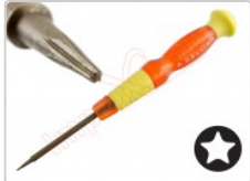
Destornillador pentalobe 0.8 para dispositivos iPhone

Para este manual necesitarás las siguientes herramientas y componentes que puedes adquirir en nuestra tienda on-line Impextrom.com Haz click encima de una herramienta para ir a la página web.