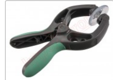
Ventosa para separar pantallas en general