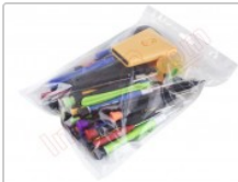
Conjunto de herramientas profesionales apertura de