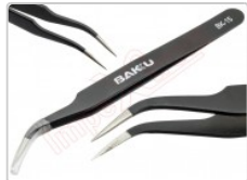
Pinza antiestática curva ESD-15

Para este manual necesitarás las siguientes herramientas y componentes que puedes adquirir en nuestra tienda on-line Impextrom.com Haz click encima de una herramienta para ir a la página web.