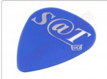
Púa especial SAT 0,70mm PET de alta fricción y resistencia