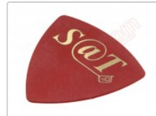
Púa especial SAT de 0.75mm de PVC de alta fricción