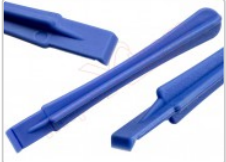
Herramienta plástica de apertura para dispositivos electrónicos

Para este manual necesitarás las siguientes herramientas y componentes que puedes adquirir en nuestra tienda on-line Impextrom.com Haz click encima de una herramienta para ir a la página web.