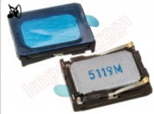
Altavoz tono de llamada genérico de 15.08 x 11.16 x 3.49 mm