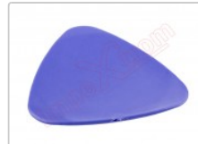
Púa plástica para apertura de smartphones y tablets