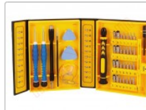
Kit profesional de herramientas de reparación dispositivos