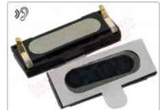
Altavoz auricular genérico de 14.93 x 6.01 x 2.88 mm