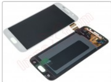
Pantalla Service Pack super AMOLED para Samsung Galaxy s6, g920f

Para este manual necesitarás las siguientes herramientas y componentes que puedes adquirir en nuestra tienda on-line Impextrom.com Haz click encima de una herramienta para ir a la página web.