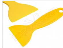
Herramienta espátula ESD para la apertura de smartphones