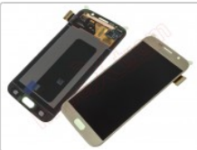
Pantalla Service Pack super AMOLED para Samsung Galaxy s6, g920f