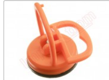
Ventosa de succión de 2.2" para desmontar smartphones