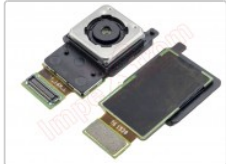
Cámara trasera de 16 mpx para Samsung Galaxy s6, g920f

Para este manual necesitarás las siguientes herramientas y componentes que puedes adquirir en nuestra tienda on-line Impextrom.com Haz click encima de una herramienta para ir a la página web.