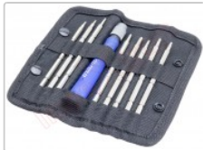
Estuche destornillador con 8 puntas Peng Fa 7339A

Para este manual necesitarás las siguientes herramientas y componentes que puedes adquirir en nuestra tienda on-line Impextrom.com Haz click encima de una herramienta para ir a la página web.