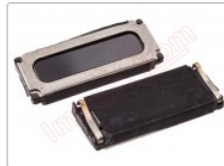
Altavoz auricular genérico de 15.02 x 6.05 x 2.55 mm