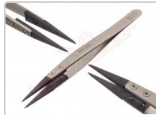
Pinzas antiestáticas VETUS ESD-259A