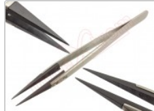
Pinzas disipadoras de electricidad, en blíster