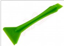
Herramienta profesional plástica doble para apertura de dispositivos

Para este manual necesitarás las siguientes herramientas y componentes que puedes adquirir en nuestra tienda on-line Impextrom.com Haz click encima de una herramienta para ir a la página web.