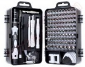
Kit destornillador precisión con 98 puntas y herramientas de