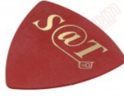
Púa especial SAT de 0.75mm de PVC de alta fricción