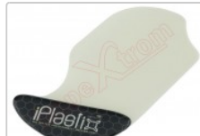
Herramienta plástica de apertura profesional iPlastix