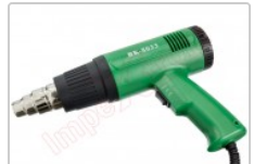
Pistola decapadora, soldador de aire caliente para reparaciones