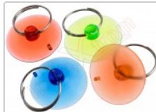
Ventosa de succión de 5.5 cm, (1UND)