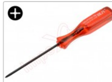
Destornillador phillips de estrella fino tamaño PH00