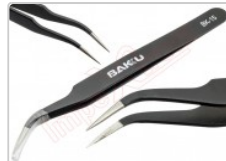
Pinza antiestática curva ESD-15