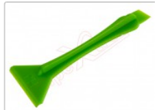
Herramienta profesional plástica doble para apertura de dispositivos

Para este manual necesitarás las siguientes herramientas y componentes que puedes adquirir en nuestra tienda on-line Impextrom.com Haz click encima de una herramienta para ir a la página web.