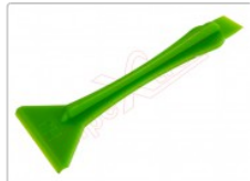
Herramienta profesional plástica doble para apertura de dispositivos

Para este manual necesitarás las siguientes herramientas y componentes que puedes adquirir en nuestra tienda on-line Impextrom.com Haz click encima de una herramienta para ir a la página web.