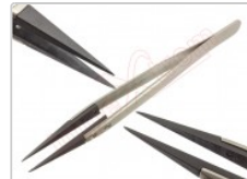
Pinzas disipadoras de electricidad, en blíster