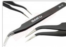
Pinza antiestática curva ESD-15