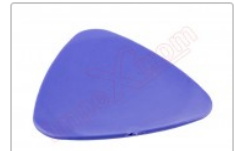
Púa plástica para apertura de smartphones y tablets