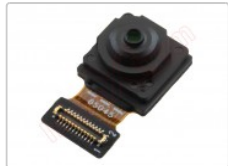
Cámara frontal de 32mpx para Huawei honor 70, fne-an00, fne-nx9

Para este manual necesitarás las siguientes herramientas y componentes que puedes adquirir en nuestra tienda on-line Impextrom.com Haz click encima de una herramienta para ir a la página web.