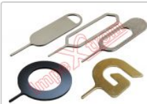
Herramienta de extracción de tarjeta SIM, 1 unidad