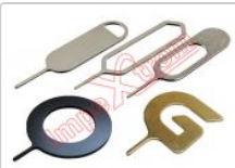
Herramienta de extracción de tarjeta SIM, 1 unidad