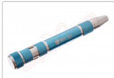
Destornillador profesional BST-927B con 9 puntas intercambiables

Para este manual necesitarás las siguientes herramientas y componentes que puedes adquirir en nuestra tienda on-line Impextrom.com Haz click encima de una herramienta para ir a la página web.