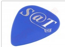
Púa especial SAT 0,70mm PET de alta fricción y resistencia