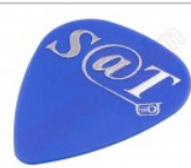
Púa especial SAT 0,70mm PET de alta fricción y resistencia