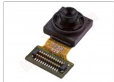
Cámara frontal de 5mpx para Samsung Galaxy a03, sm-a035f

Para este manual necesitarás las siguientes herramientas y componentes que puedes adquirir en nuestra tienda on-line Impextrom.com Haz click encima de una herramienta para ir a la página web.