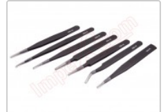
Set de 7 pinzas de precisión antiestáticas