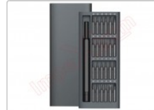
Destornillador alta calidad con 24 puntas de repuesto magnéticas 6024-C