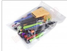
Conjunto de herramientas profesionales apertura de