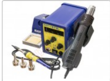
Estación doble de soldadura SMD con soldador Baku 878 L2

Para este manual necesitarás las siguientes herramientas y componentes que puedes adquirir en nuestra tienda on-line Impextrom.com Haz click encima de una herramienta para ir a la página web.