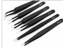
Set de 6 pinzas de precisión antiestáticas