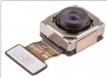
Cámara gran angular y macro trasera de 8mpx para oppo find x2 lite, cph2005

Para este manual necesitarás las siguientes herramientas y componentes que puedes adquirir en nuestra tienda on-line Impextrom.com Haz click encima de una herramienta para ir a la página web.