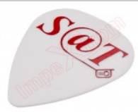
Púa especial SAT 0,6mm PET de alta fricción y alta resistencia