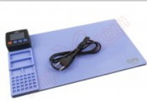
Tapete térmico de apertura mediante calor, CPB320