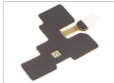
Módulo de antena nfc para Samsung Galaxy s21 ultra 5g, sm-g998b

Para este manual necesitarás las siguientes herramientas y componentes que puedes adquirir en nuestra tienda on-line Impextrom.com Haz click encima de una herramienta para ir a la página web.