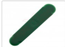
Herramienta de apertura plástica profesional BST-134

Para este manual necesitarás las siguientes herramientas y componentes que puedes adquirir en nuestra tienda on-line Impextrom.com Haz click encima de una herramienta para ir a la página web.