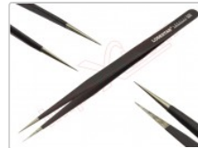
Pinza antiestática de precisión ESD-12 con punta fina