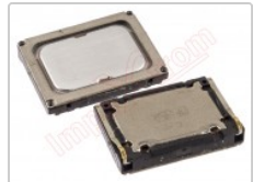
Altavoz genérico de 15.07 x 11.01 x 2.5 mm