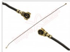
Cable coaxial de antena de 86 mm

Para este manual necesitarás las siguientes herramientas y componentes que puedes adquirir en nuestra tienda on-line Impextrom.com Haz click encima de una herramienta para ir a la página web.