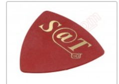
Púa especial SAT de 0.75mm de PVC de alta fricción