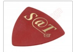
Púa especial SAT de 0.75mm de PVC de alta fricción