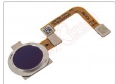
Lector de huellas violeta (sparkling blue) para realme 5 pro (rmx1971)

Para este manual necesitarás las siguientes herramientas y componentes que puedes adquirir en nuestra tienda on-line Impextrom.com Haz click encima de una herramienta para ir a la página web.