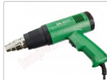
Pistola decapadora, soldador de aire caliente para reparaciones