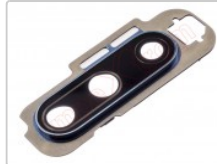
Embellecedor azul con lente de cámaras para oneplus 7t pro (hd1913)